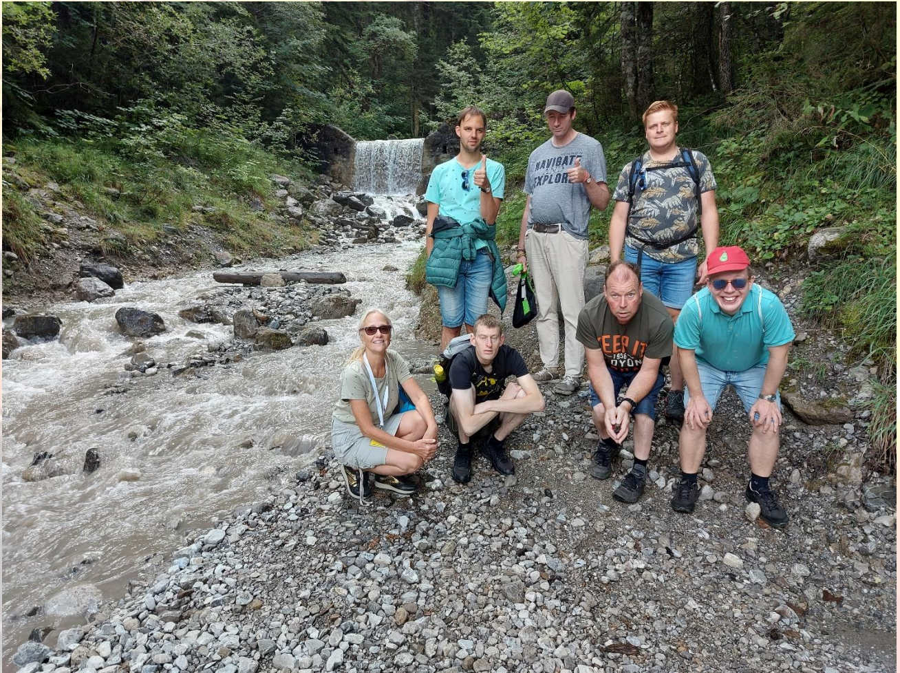
Door al die regen actieve watervallen ...