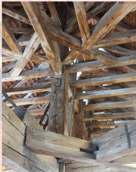
Die "dak" spanten, wat een vakwerk...prachtig